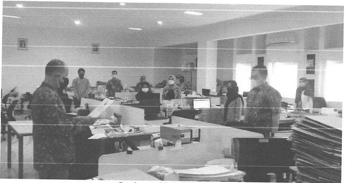
Pembacaan Naskah Pancasila

Lampiran Surat Nomor: 5773/UN7.P/TU/2021